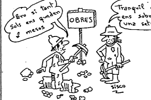
Ulldecona es prepara per a les festes Quinquennals 89.

Finalment la cosa ja marxa i ja es treballa en fer la tuberia que abocarà les aigües residuals al riu en lloc de servir per a regar.